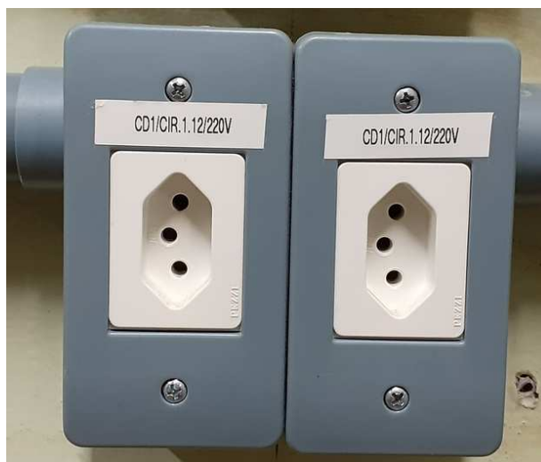
Figura 1 - Exemplo de identificação de tomada.

Todas as tomadas devem ter a identificação do circuito ao qual pertencem através de etiquetas adesivas. Um exemplo de identificação de tomada pode ser visto na Figura 1, onde está identificado o quadro de distribuição, o circuito e a tensão da tomada.